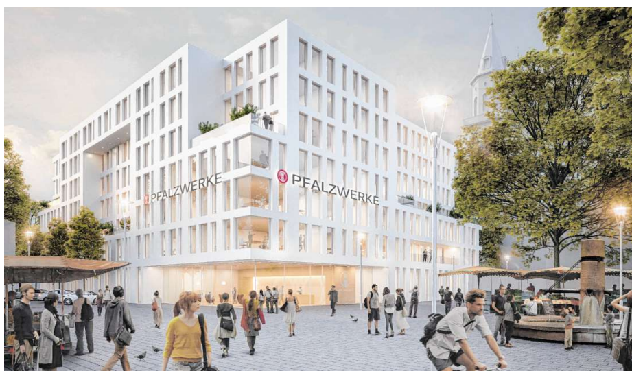
So soll der siebengeschossige Neubau für die Pfalzwerte aus Richtung Berliner Platz künftig aussehen.